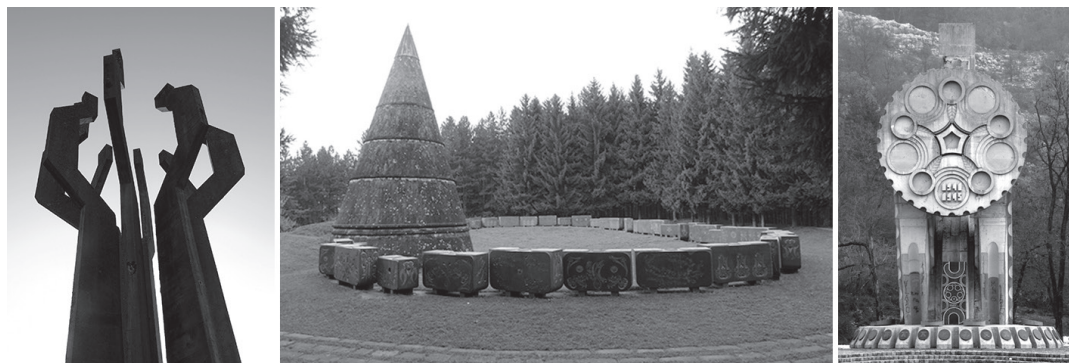
Slika 5. Spomenik na Barutani, Podgorica (1976–1980); Spomenik Slobodi na Jasikovcu, Berane (1975–1977); Spomenik pod Trebjesom, Nikšić (1985–1987). (sa lijeva na desno)