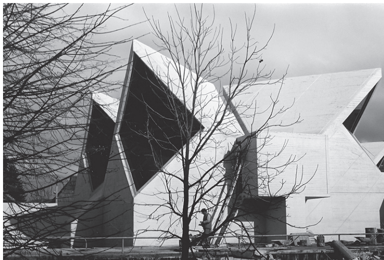
Slika 3. Spomen-dom u Kolašinu (1971–1975), realizacija prvonagrađenog rješenja na opštem, jugoslovenskom konkursu