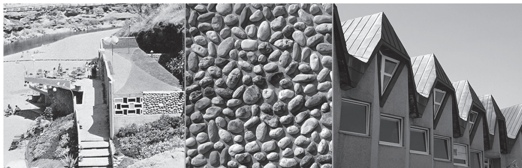
Slika 2. Ambijentalnost i vernakularnost: Kajakaški klub „Galeb”, Podgorica (1960); Hotel „Podgorica”, Podgorica (1968), detalj fasade – morački oblutak; Poslovno-administrativni objekat, Žabljak (1964) (sa lijeva na desno).

Transformacija modernističkog idioma u strukturalistički najbolje se ilustruje kroz proces projektovanja i realizaciju Zgrade republičkih društveno-političkih organizacija (1965–1979) 51 arhitekta Radosava Zekovića, gdje su čiste, kubične modernističke forme i elementi iz prvonagrađenog konkusnog rješenja (1965), u procesu preprojektovanja za izgradnju objekta (1978–1979), u potpunosti transformisani u strukturalističke (Stiller, 2013, 180–183). Neosporan kvalitet i originalnost ovog objekta, valorizovan je dodjelom Republičke „Borbine nagrade” za 1979. godinu (Alihodžić, 2015, 104–109).