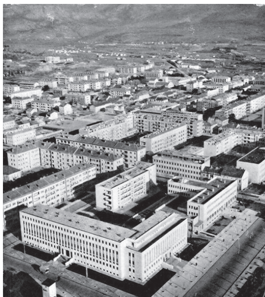
Slika 1. Podgorica (Titograd) početkom 60-ih godina – modernistički oblikovni idiom

Izrazito modernistički modeli, koje karakteriše dominacija kubičnih masa i zidnih platana, ravni krovovi i otvorena prizemlja praćena kolonadama stubova i laganim nadstrešnicama, horizontalni nizovi otvora i sl., biće prisutni sve do polovine 60-ih godina, a u nešto modifikovanom obliku i kasnije.